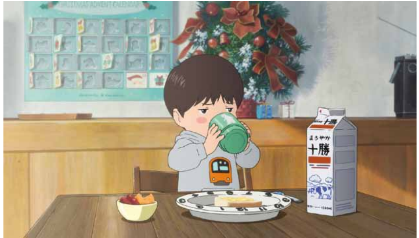
Mirai, ma petite sœur de Mamoru Hosada

et qu'il faut en réalité prendre une correspondance pour aller à Tokyo, que les distances entre ces villes ne sont pas très grandes ; le voyage de Kun n'est donc pas très long... etc.