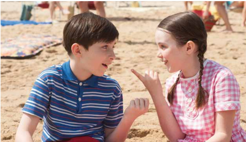
Les Vacances du Petit Nicolas de Laurent Tirard, France, 2014