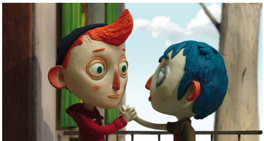
Ma vie de courgette de Claude Barras, France, 2016