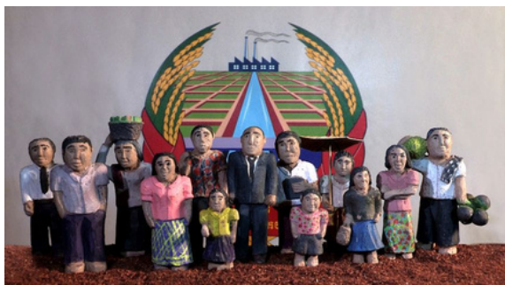
L'image manquante, Rithy Panh, 2013

Présentation des films à destination des collèges et lycées